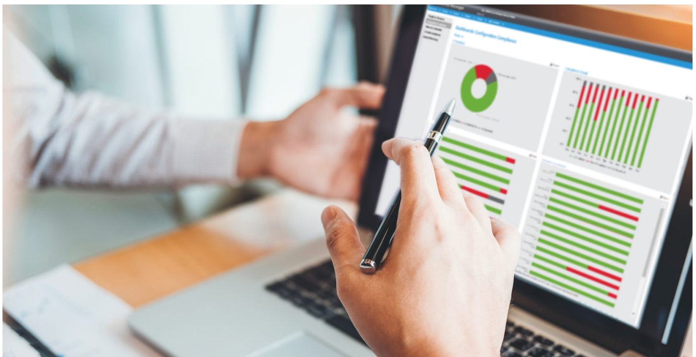
Xerox Printer Security Audit Service

Ganzheitliche Sicherheit ist in jeden Aspekt der Managed Print Services integriert, einschließlich der zugehörigen Tools und Analysen, sodass Sie darauf vertrauen können, dass Vorschriften eingehalten werden und Sie geschützt sind. Eine integrierte Kombination aus Kunden-Elementen vor Ort und von Xerox gehosteten Elementen sorgt für Flexibilität und Konnektivität, ohne die Sicherheit zu beeinträchtigen.