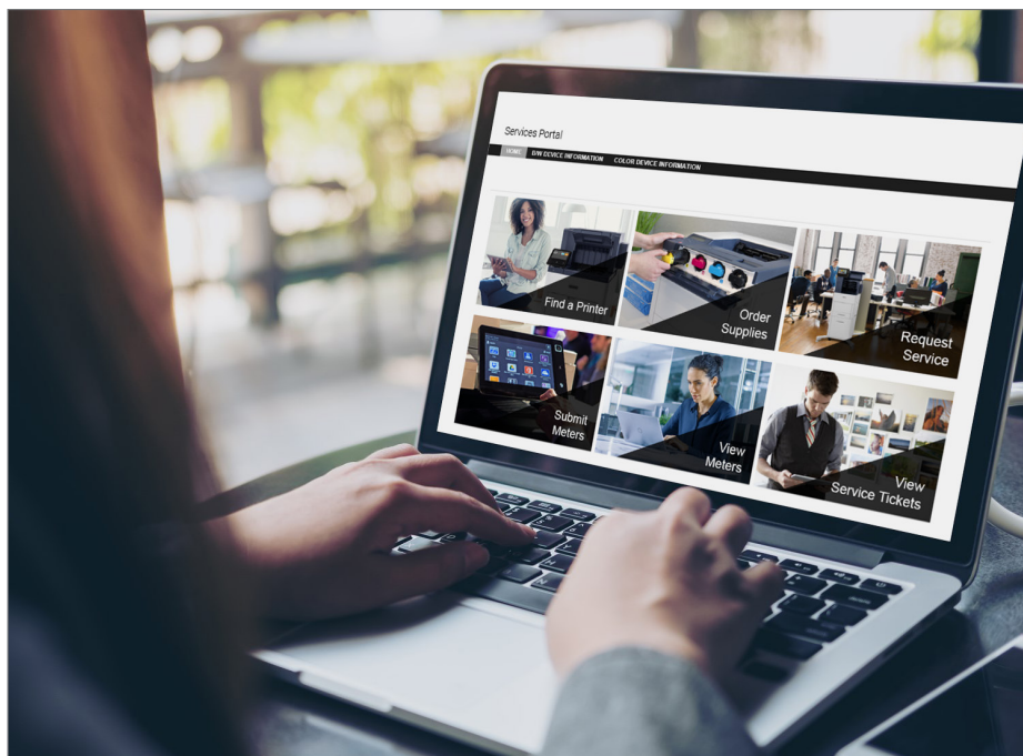
Xerox Services Portal