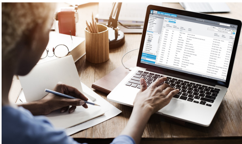
Xerox Services Manager

Transparenz aller Aktivitäten bei Vorfällen, Closed Loop Feedback, jedes Gerät (einschließlich Non-Xerox) jederzeit und an jedem Ort verfolgbar, Zeitersparnis durch automatische Nachbestellung von Verbrauchsmaterial, präzise Geräteverfolgung und optimierte Gerätelaufzeit für maximale Produktivität